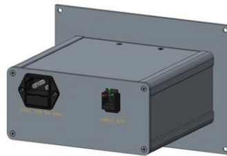
Face arrière pour version NTP/PoE câble fourni : 3 m Ethernet CAT5E