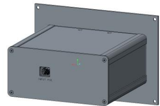
Face arrière pour version NTP/230 VAC et 2 m Power AC EU/IEC C13