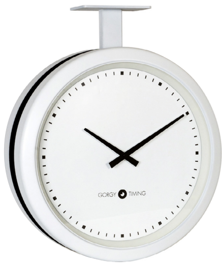
HANDI 450 double face