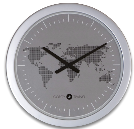
HANDI 450 planisphère