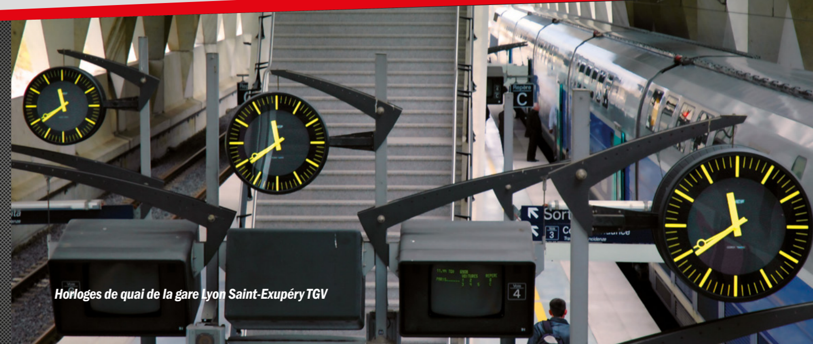
Horloges de quai de la gare Lyon Saint-Exupéry TGV